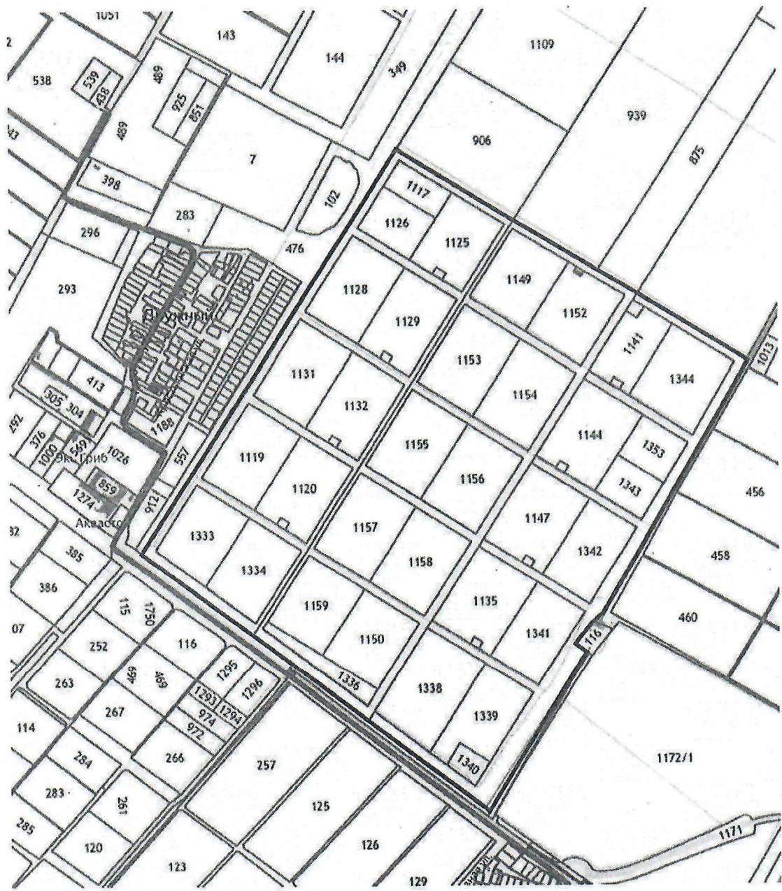
Схема границ проектирования